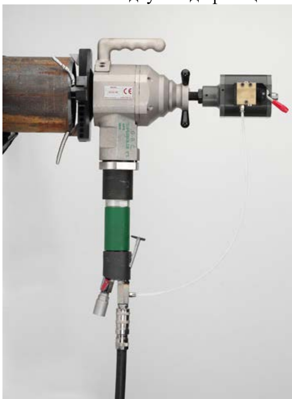
SUPERBOILER T5 P

SUPERBOILER T5 устанавливается в деталь по внутреннему диаметру. Сменные вставки для цанги входящие в базовый комплект приставки позволяют обеспечивать широкий диапазон крепежных диаметров и при этом обеспечивать надежное закрепление станка в детали. Машины SUPERBOILER T5 изготавливаются в двух модификациях: - пневмоприводом и с электроприводом.