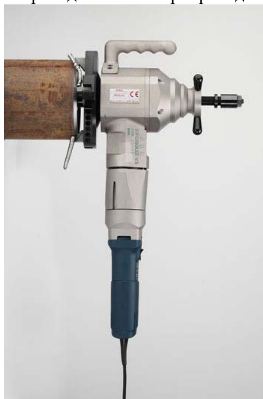
SUPERBOILER T5 E